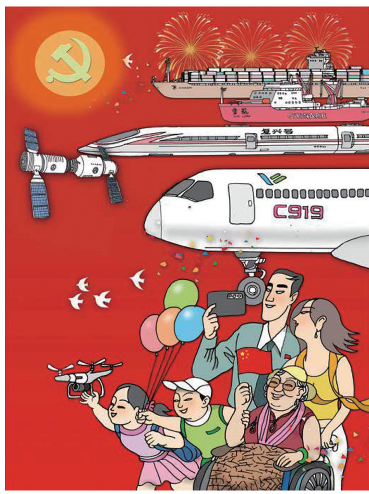
↑ 新征程 沈天呈 ← 凝心铸魂 申宁涛