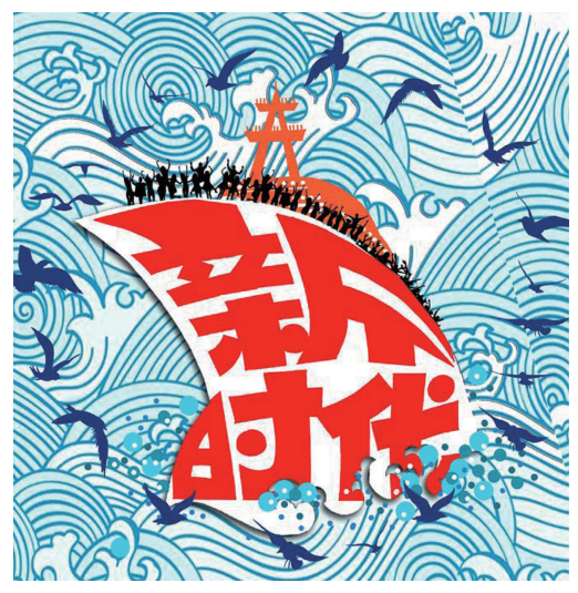
↑ 乘风破浪 夏正大 ← 同根生 姬大利