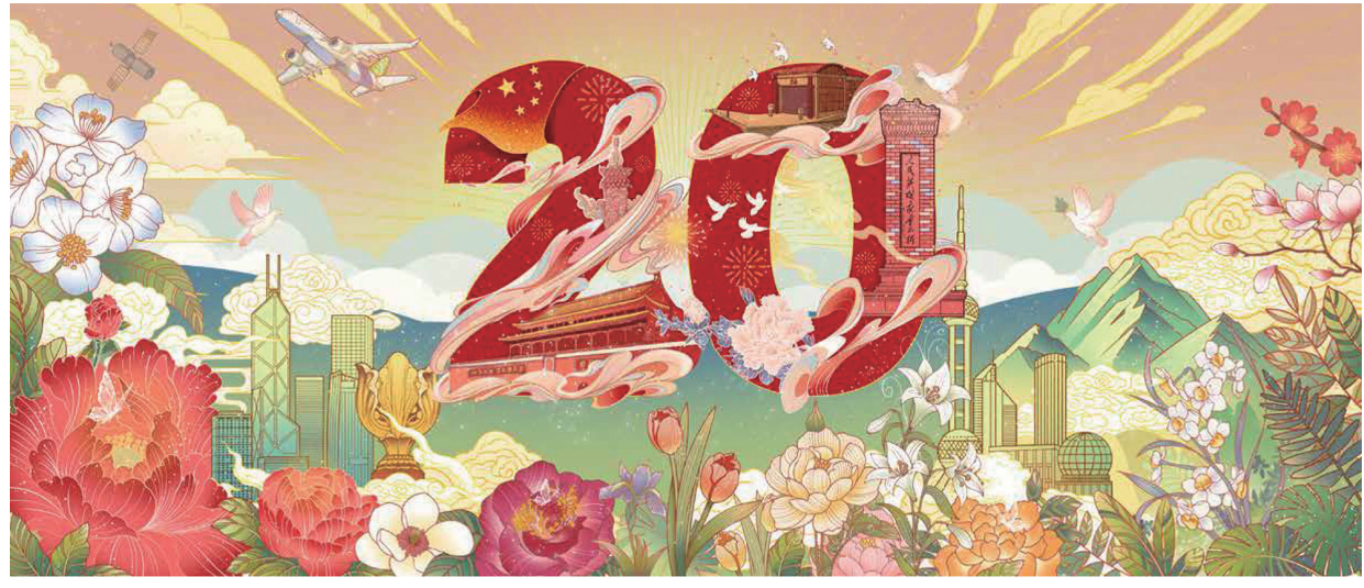
← 奋进新征程 张天伦