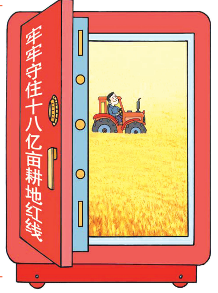
← 红色保险柜 姚月法