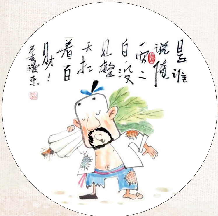
↑ 扛“百财” 李伟