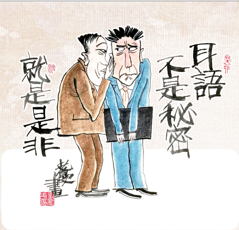
↑ 耳语 刘曼华