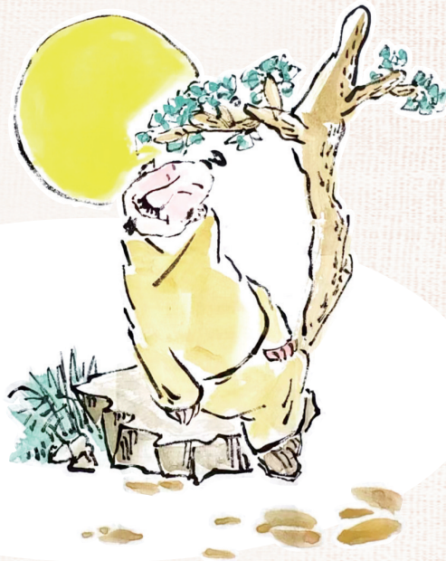
← 最好的状态 王培琪