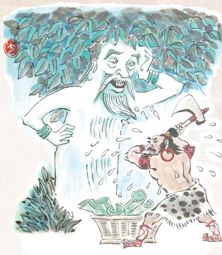
← 济世救人，桂树不怕刷，吴刚不怕累 曹昌光