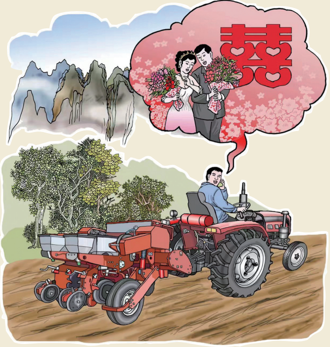
未婚妻：我们明年五·一就结婚吧！ 丰收路上有“喜”讯 张书信