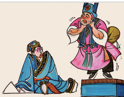
差役夺妻走,圣僧救书生。