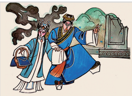
夜走白虎岗,夫妻遇尸魔。