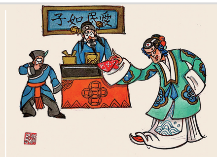
搅闹钱塘县,救出赵文妻。