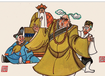
醉酒大雄殿,济公戏广亮。