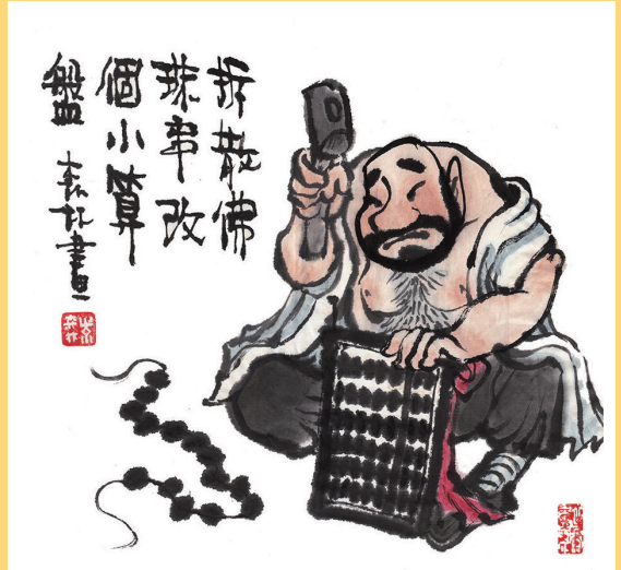
拆散佛珠串, 改个小算盘