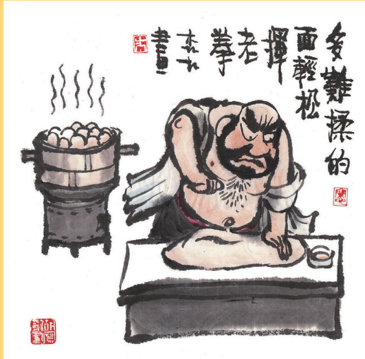
多难揉的面, 轻松挥老拳