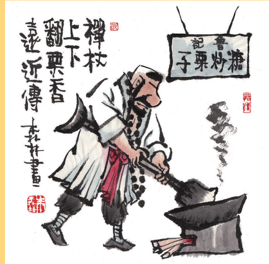
禅杖上下翻, 栗香远近传