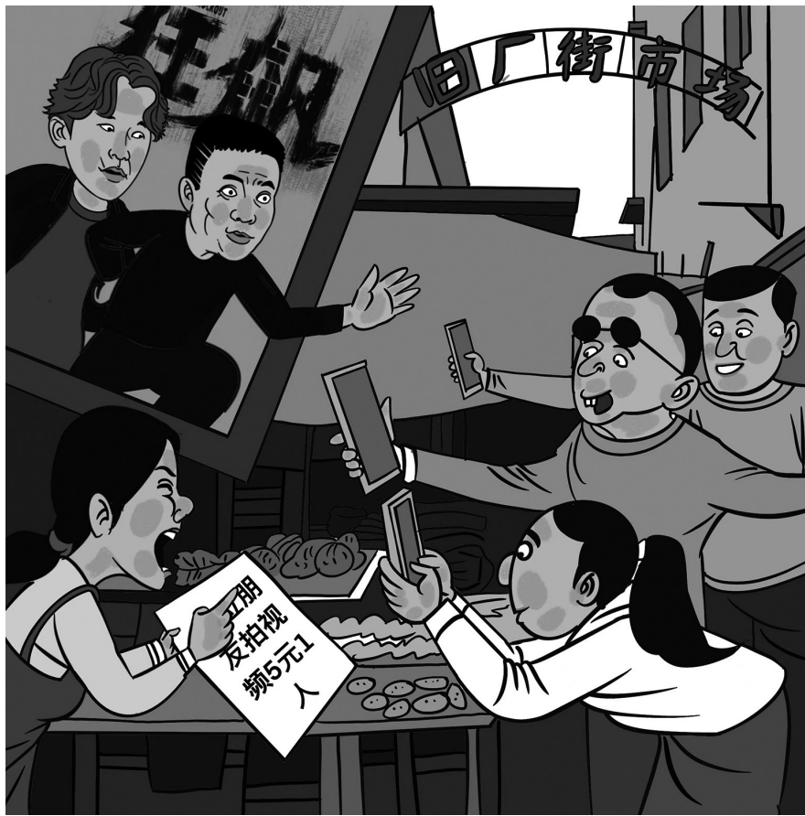
此路是我开 赵曙合

随着电视剧《狂飙》热播,广东省江门市“旧厂街市场”的取景地也变成了热门打卡地。网友日前发现,有市场摊主将“旧厂街市场”招牌用布盖住,并明码标价“拍视频5元1人”。事后市场相关负责人表示,将来不会、也不可能向游客收费,欢迎各地游客来江门旅游。