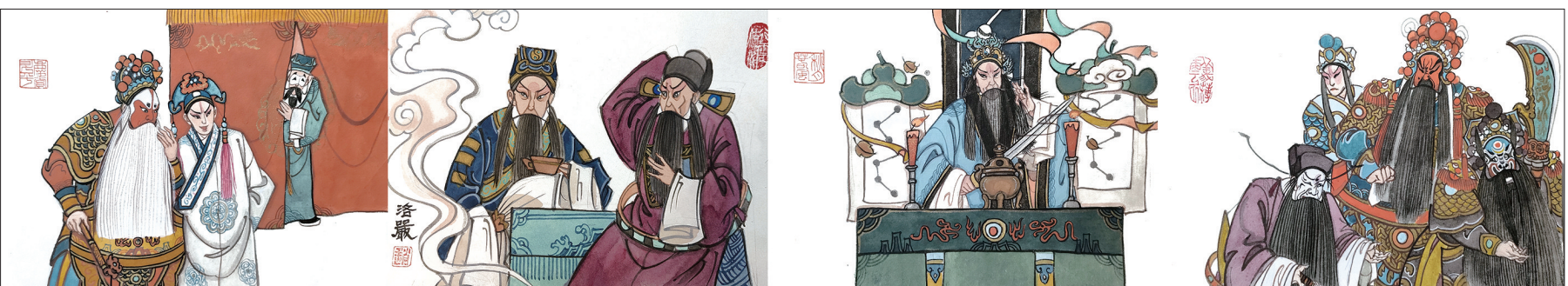
公瑾设摆群英会，蒋干盗书杀蔡张。霎时江面白雾厚，借得雕翎百万还。坛台借风助周郎，再返夏口做商量。华容遭困逢故交，望君念旧放回逃。

周瑜设群英会，利用蒋干盗书使用借刀杀人之计，后曹操又中草船借箭之计和苦肉计，孔明借东风火烧战船，曹操大败而逃，在华容道又遭遇关羽的大军。(注：《群·借·华》即《群英会》《借东风》《华容道》三出折子戏。)