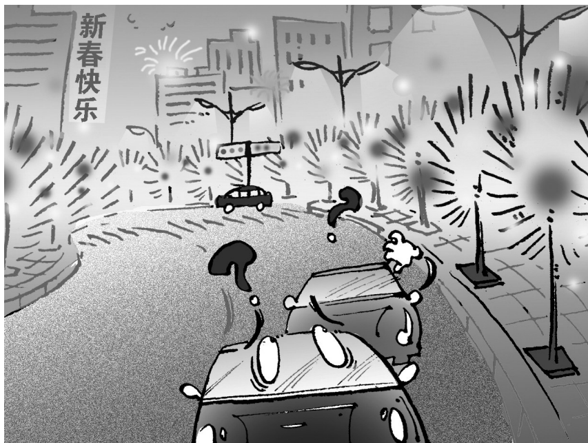
← 红绿灯笼迷人眼 马青海