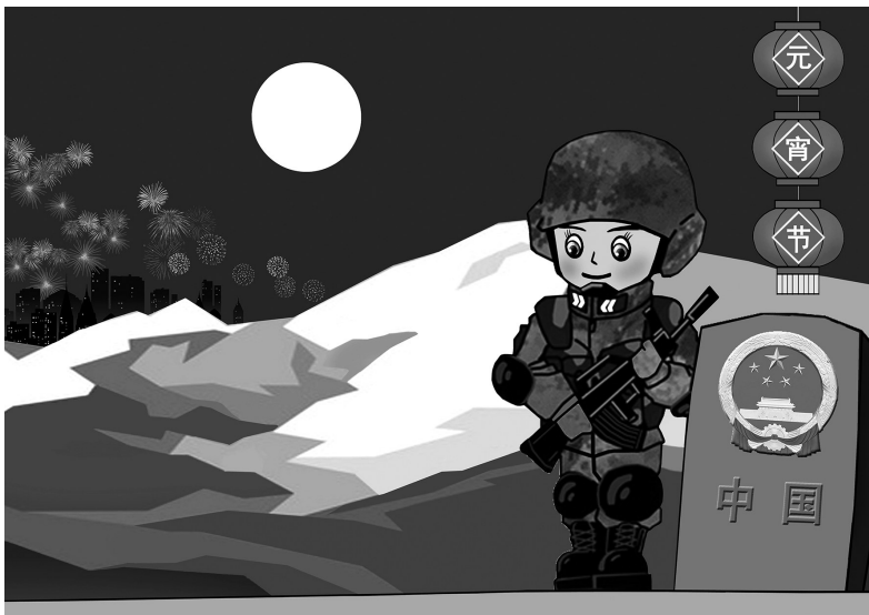
↑ 灯红月圆夜无眠 乔 维