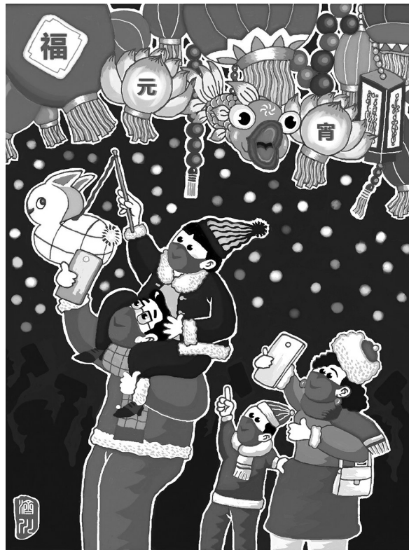
↑ 赏花灯 李济川