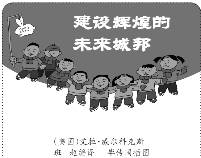
(美国)艾拉·威尔科克斯 班超编译 毕传国插图

新的一年,正是用手中的五彩丝线织造新生活的大好时机,请不要沉湎于往事,念念不忘逝去的欢笑、幸福。