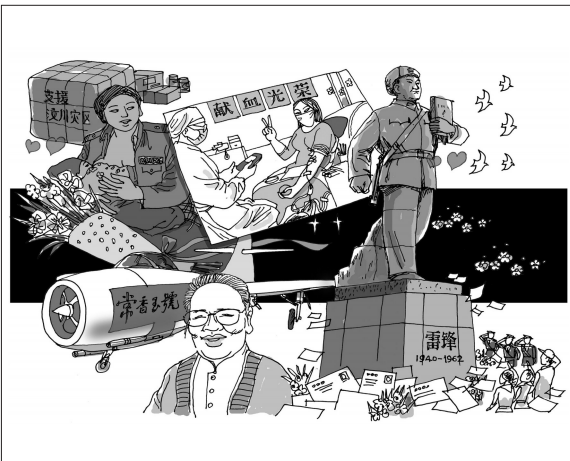
助人为乐必定迎来新的篇章。