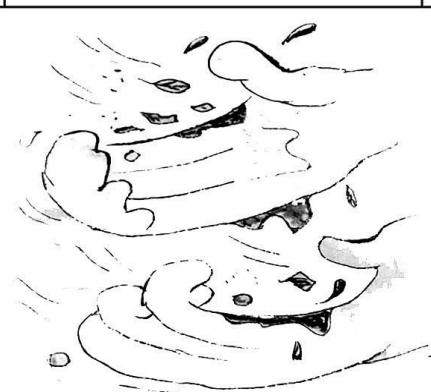
15. 水可哺万物，却从无索取，其为“周济天下”。