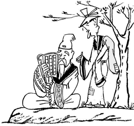
2. 路遇一智者静坐，商人便向智者倾诉惨痛经历。