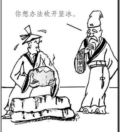
你想办法砍开坚冰。 4. 智者让商人从地窖里拿出一块非常大的坚冰来。