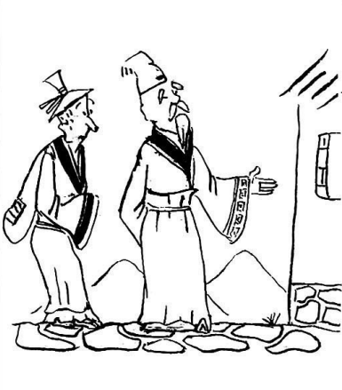
3. 智者没说什么，带着商人来到自己的住处。