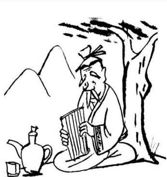
18. 人应该如水一般，拥有改变自己去适应社会，却又不被社会磨平的生活态度。