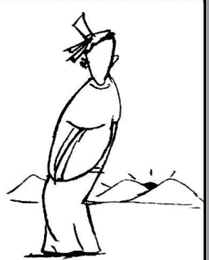
21. 智者一番话，令商人大彻大悟，他终于又扬起了坚定和自信生活的风帆。