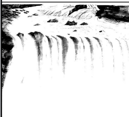
13. 水高倾下，遇阻顺过，遇峭磨圆，水滴石穿，其为“以柔克刚”。