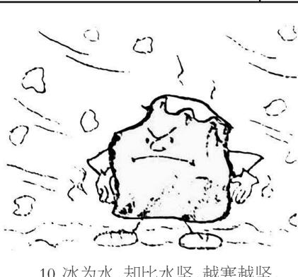
10. 冰为水，却比水坚，越寒越坚，其为“百折不挠”。