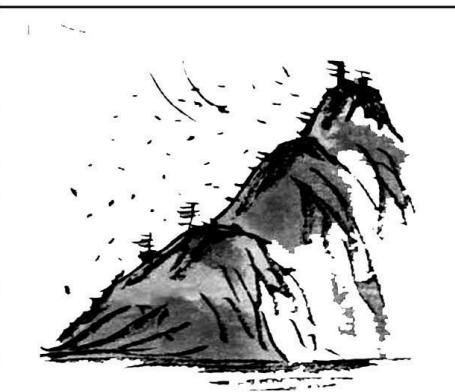
16. 雾化为水，聚可结雨，散可无影，飘忽于天地之间，其为“功成身退”。