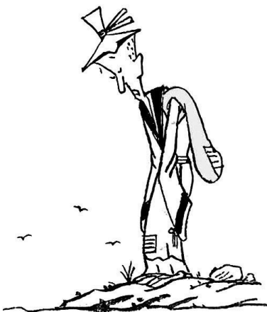
1. 商人被同伙出卖，人财两空，欲跳河自尽。