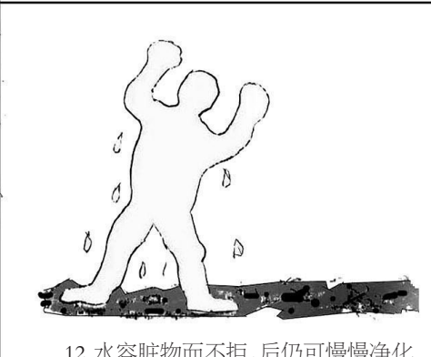
12. 水容脏物而不拒，后仍可慢慢净化自己，其为“包容接纳”。