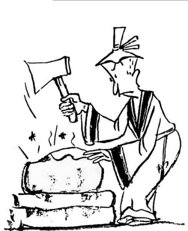
5. 商人找来斧头用力向坚冰砍去，却只砍出一道道冰印。