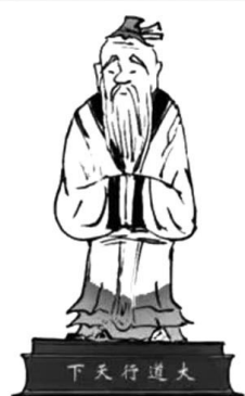
17. 善良是一个人的最大实力，上善若水是一个人的最好状态。