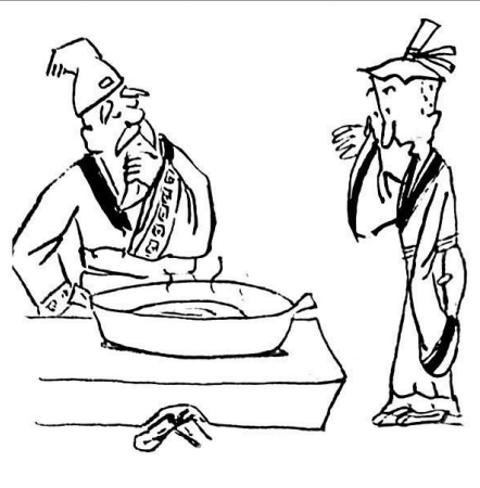
8. 不久，冰化成了水，商人看呆了。智者问，你悟出什么道理了吗？