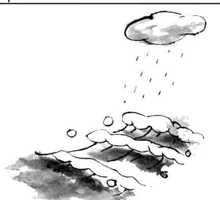
14. 水化为雾，高至云端，下化为露，涓聚大海，其为“能屈能伸”。