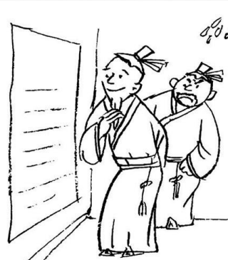
20. 喜怒哀乐不愧于心，大起大落波澜不惊。智慧源于生活，又高于生活。