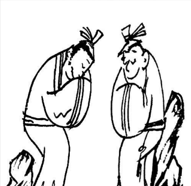
19. 能用包容去理解他人，却又不强求谁都能理解自己。