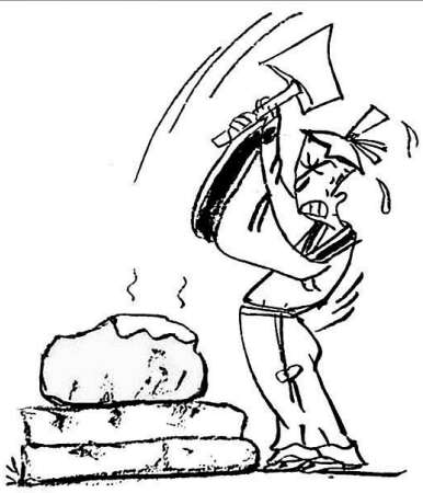
6. 他又抡起斧子猛砸，坚冰却还是坚如磐石。