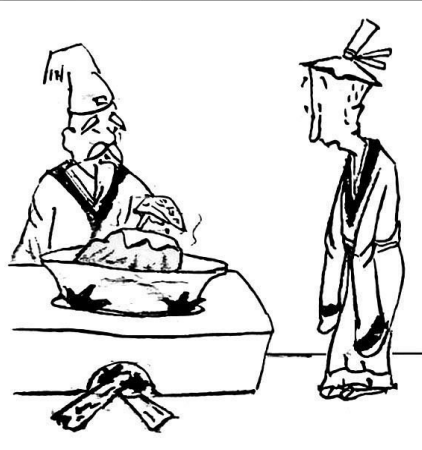
7. 智者让商人将冰块放在锅里加热慢慢融化。