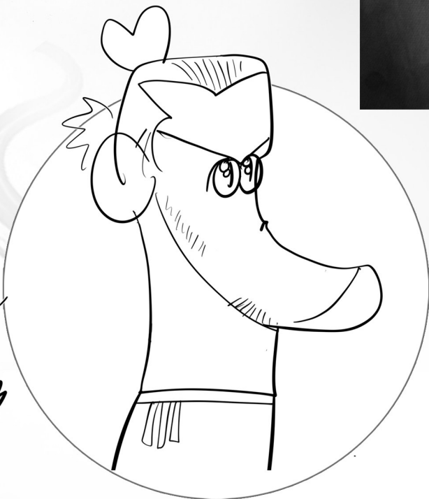
↑加雷思·贝尔(威尔士)