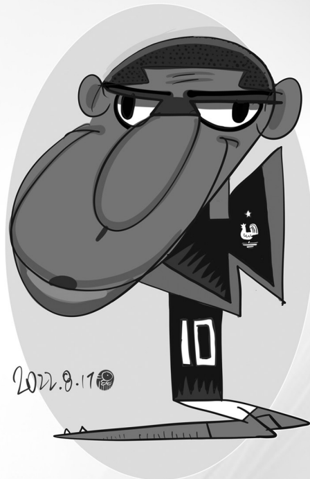
←基利安·姆巴佩(法国)