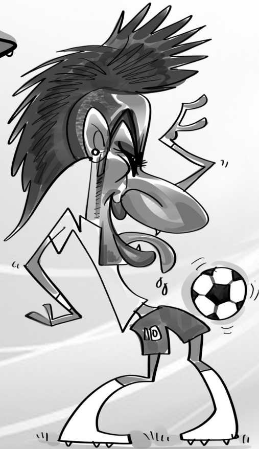
←内马尔·席尔瓦·儒尼奥尔(巴西)