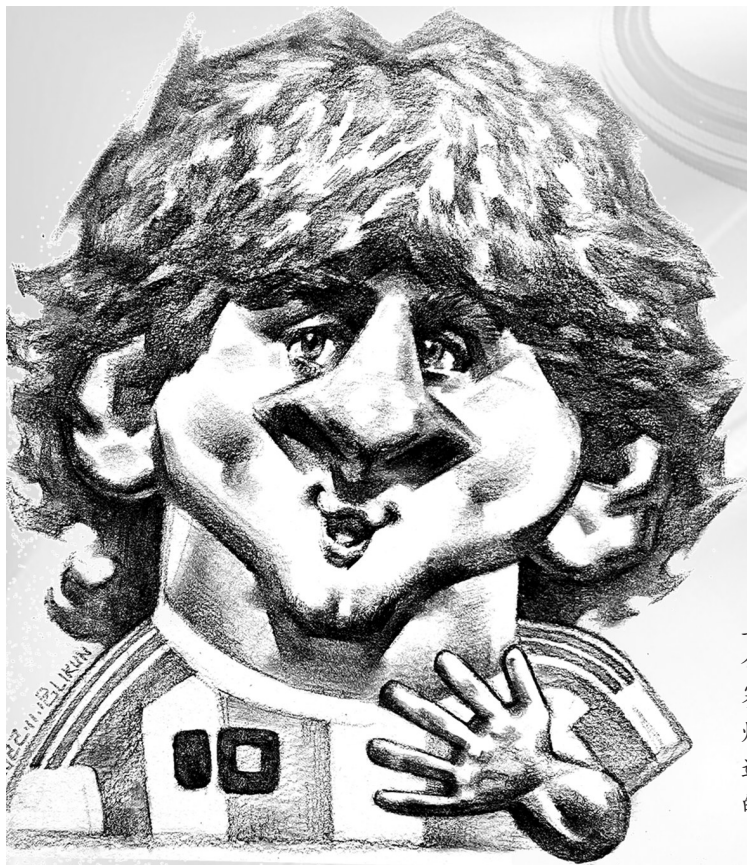
↑利昂内尔·梅西(阿根廷)