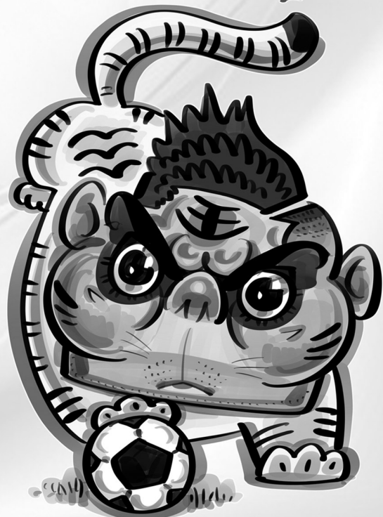
←卡洛斯·恩里克·卡塞米罗(巴西)