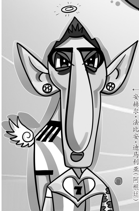
←安赫尔·法比安·迪马利亚(阿根廷)