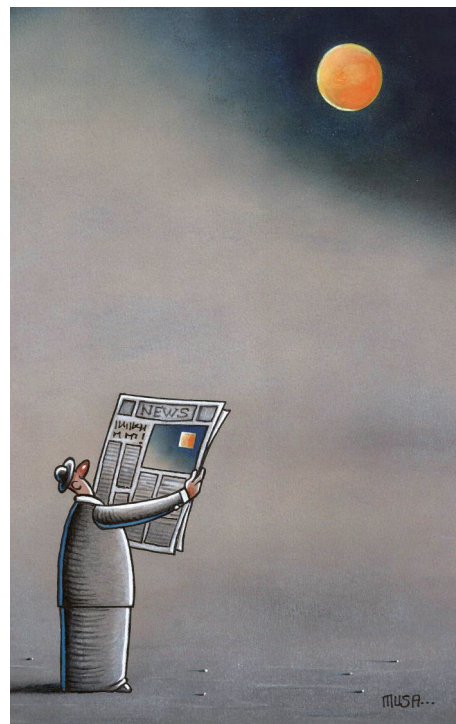
睁眼说瞎话 穆萨·古姆斯(土耳其)