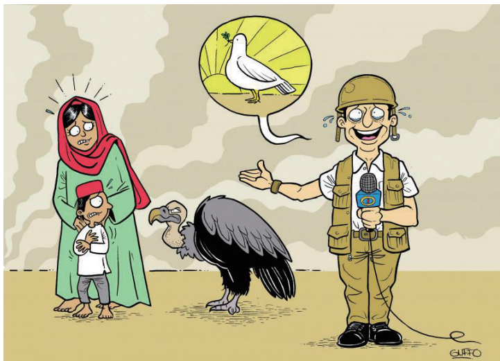
公开造谣 古佛(墨西哥)