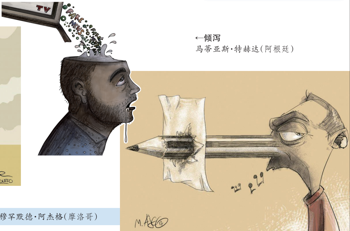
←倾泻 马蒂亚斯·特赫达(阿根廷)