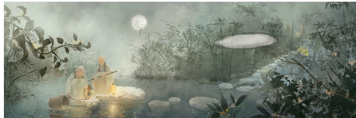
↑ 忆江南 施雨桐(指导老师 武小锋)