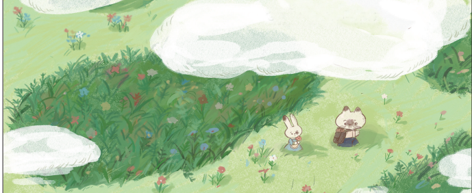
↑ 柔软又特别的朋友 侯 鹭(指导老师 刘雪丹)