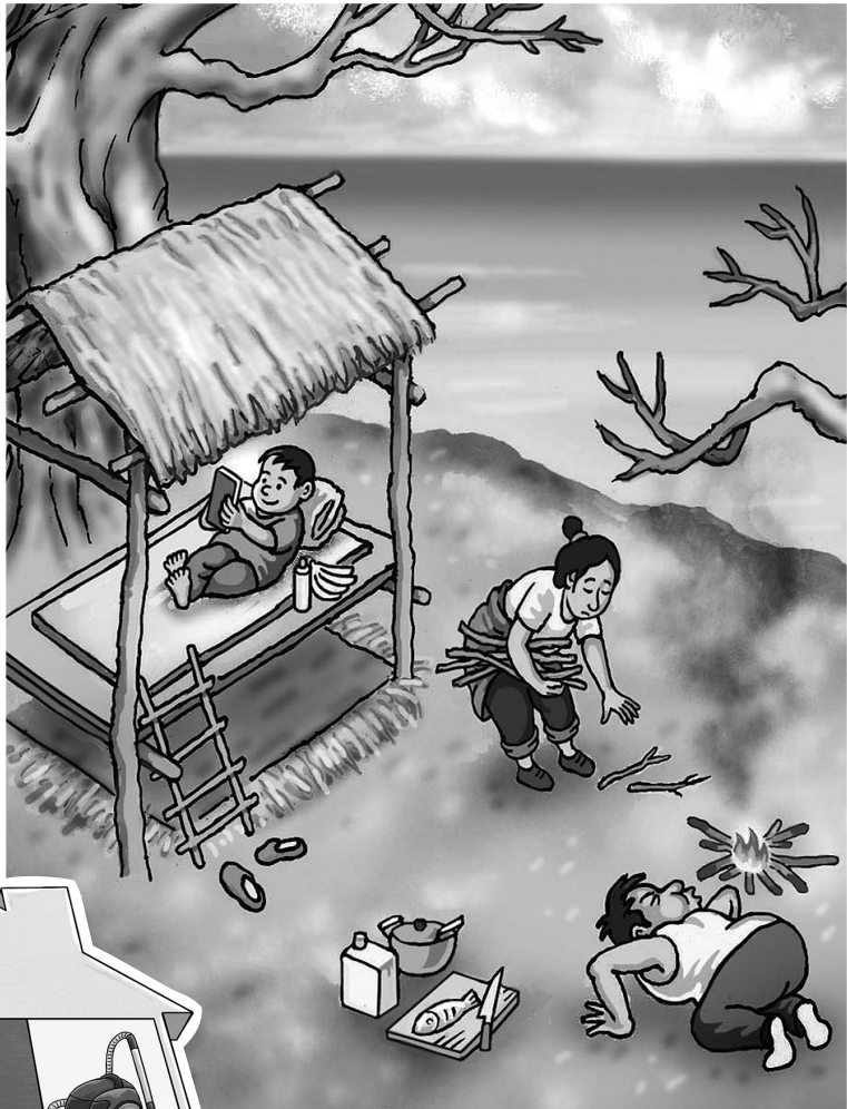
↑“荒岛求生”教育 仲 海

家是启航的灯塔 照亮我们行程 家是归程的路标 指引我们方向 家是永远的驿站 补充我们能量 家是心灵的港湾 这里不会让我们 感到孤单 ... ..