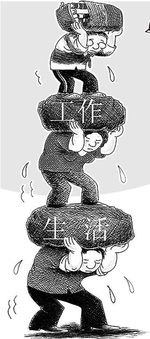
↑压力 卢 军