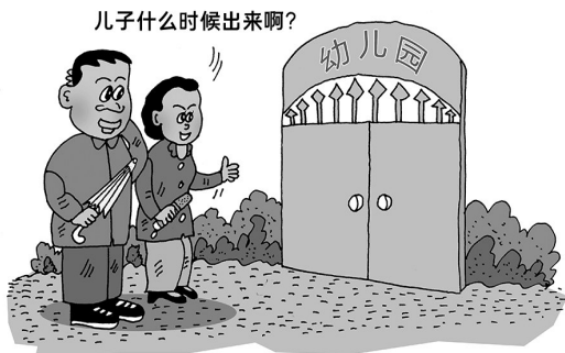
儿子什么时候出来啊?