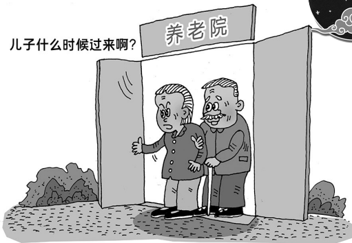
儿子什么时候过来啊?