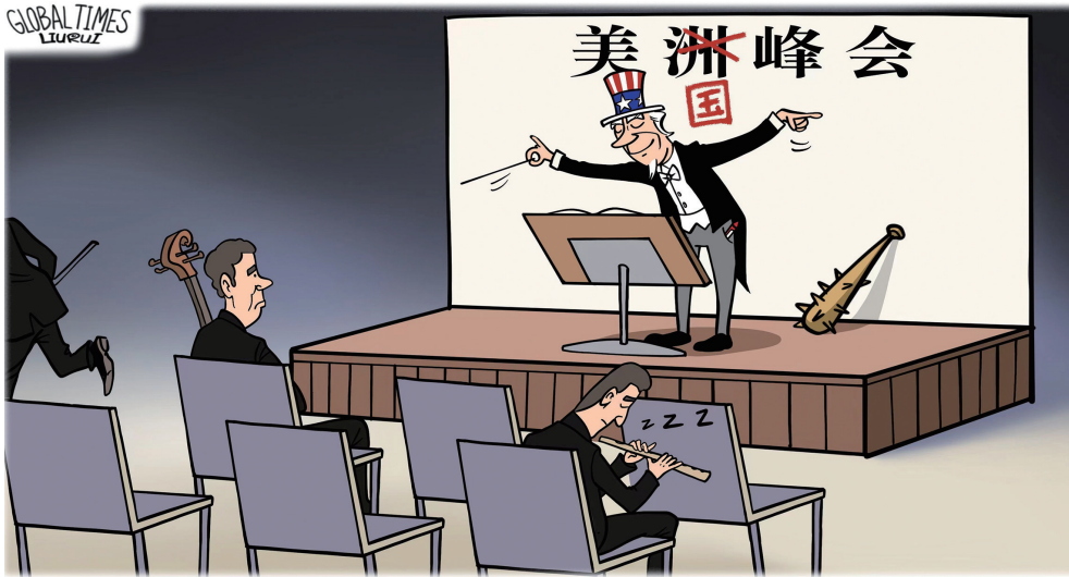
↑ 他的会 刘蕊

“我们很遗憾在我们的直播中出现了这个错误……”近日,美国有线电视新闻网(CNN)亚太地区的一名公关总监承认,该媒体有关“中国代表团在达沃斯拒绝为乌克兰总统泽连斯基鼓掌”的报道失实。西方媒体眼神不好,造谣生事的本事倒不小。