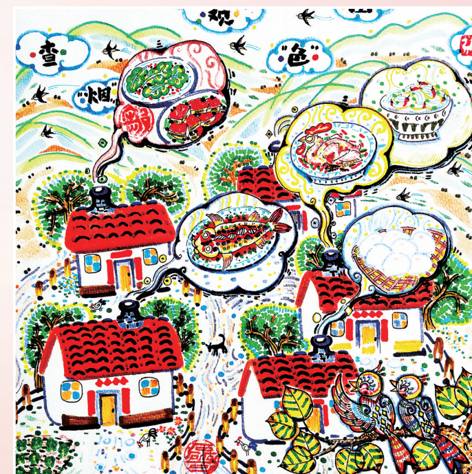
↑ 察“烟”观“色”图 邹 磊