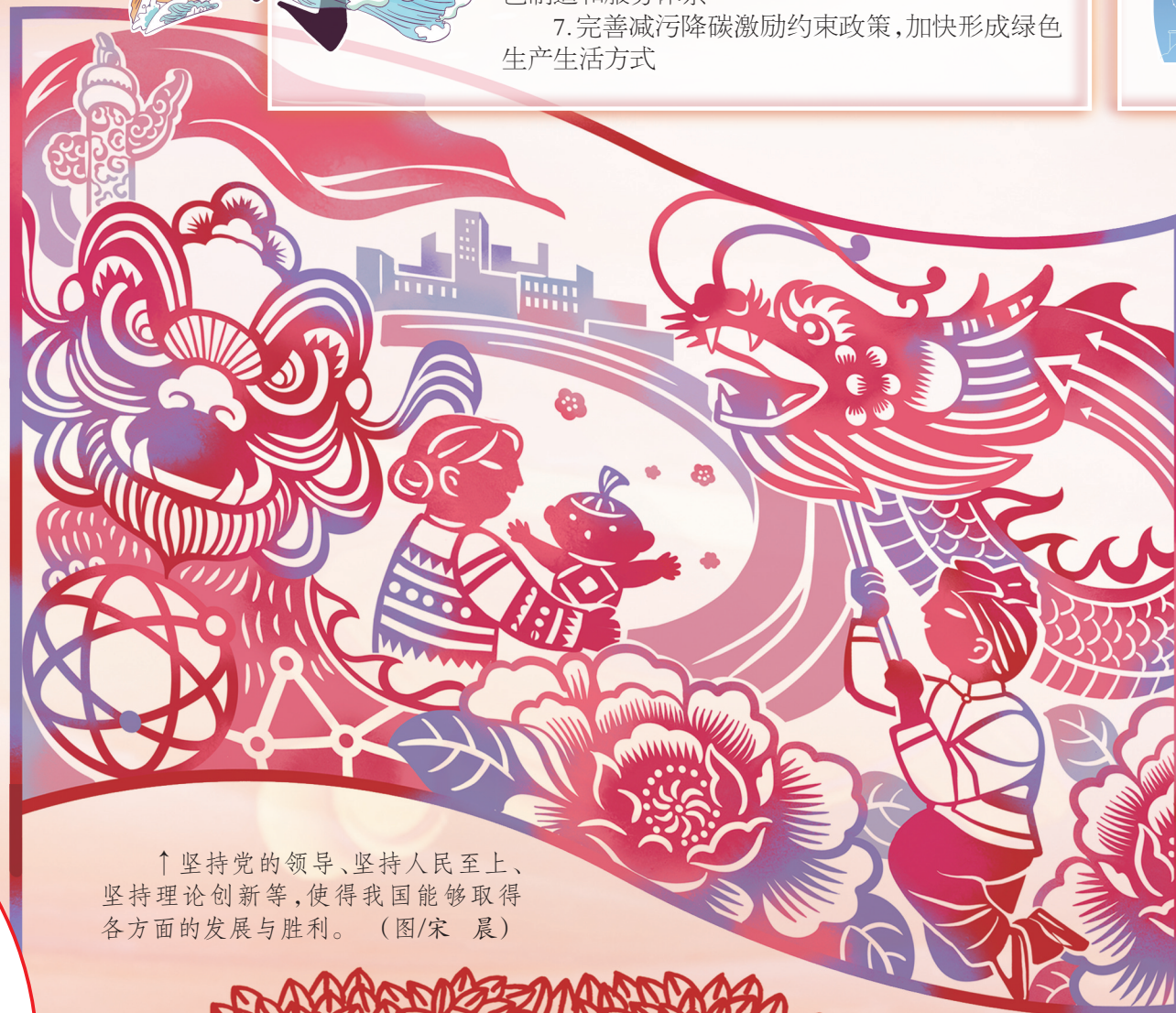
↑ 坚持党的领导、坚持人民至上、坚持理论创新等,使得我国能够取得各方面的发展与胜利。