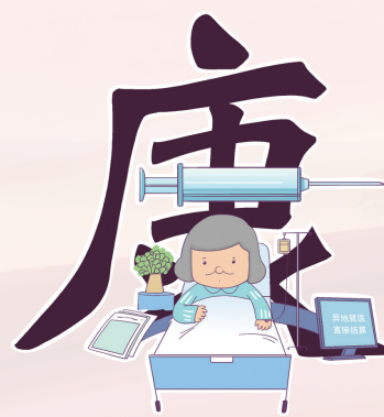
祁 娇 娜