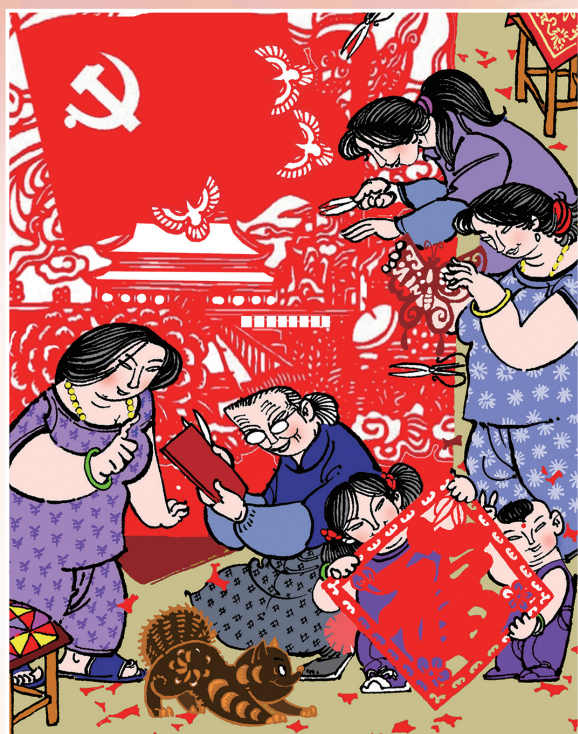
↑ 福 娃 马青海