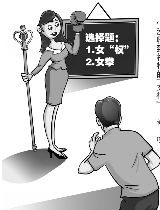
← 没收到礼物的「女神」 刘明