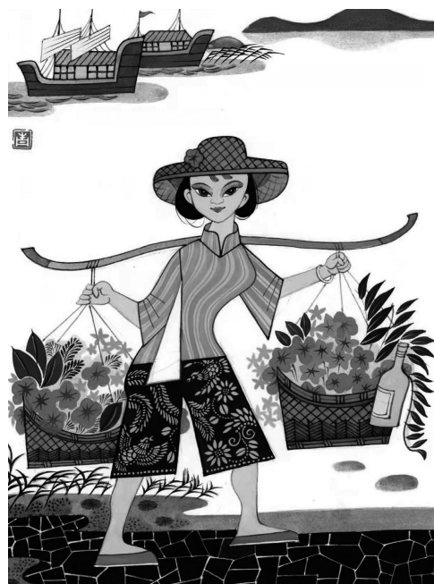
← 南国珠江一枝花 劳动致富更娇艳 幸福香飘万千家