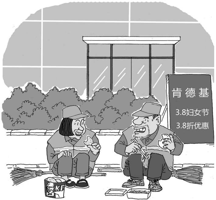
↑ 最浪漫的事 姬大利