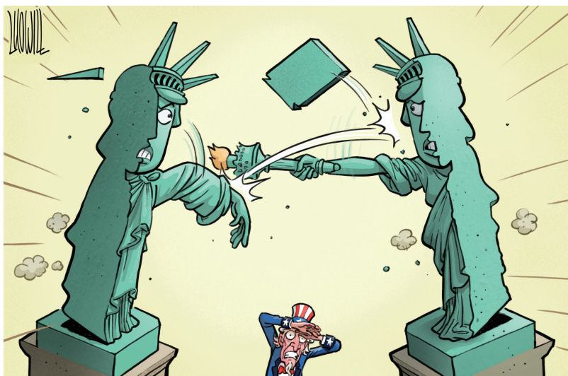
↑ 美国社会撕裂严重