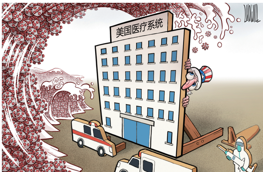
← 美国医疗体系崩溃