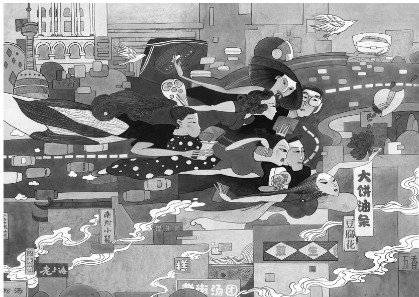
↑ 清晨从这里开始 祁娇娜