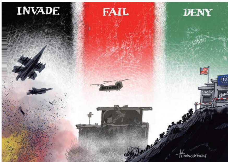
↑ 三部曲:入侵·败退·拒绝

美国苦心经营多年、装备精良的三十万阿富汗军队居然未做抵抗就投降了,恐怕连胜利者塔利班也是始料未及。