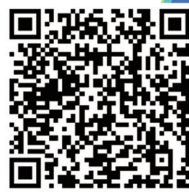
扫码进入赛事通道