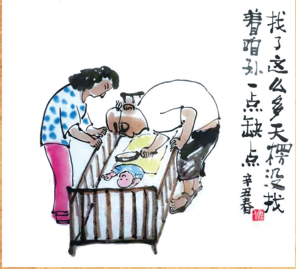
找了这么多天，愣没找着咱孙一点儿缺点。