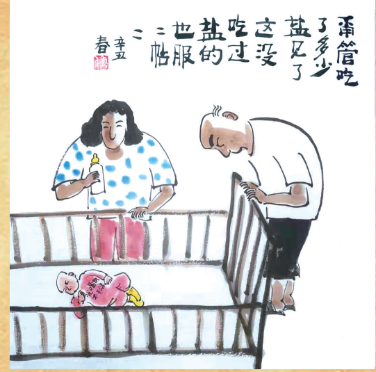
甬管吃了多少盐，见了这没吃过盐的， 也服服帖帖。