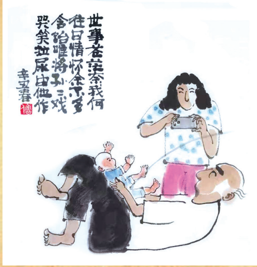
世事苍茫奈我何，往日情怀余不多。 含饴唯将孙儿戏，哭笑拉屎由他作。