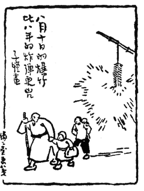
图一 八月十日的爆竹比八年的炸弹更凶

(作者系中国政法大学教授)注：图一选自《丰子恺的抗战》，海豚出版社。图二选自《生生画刊》，1947年1月27日。