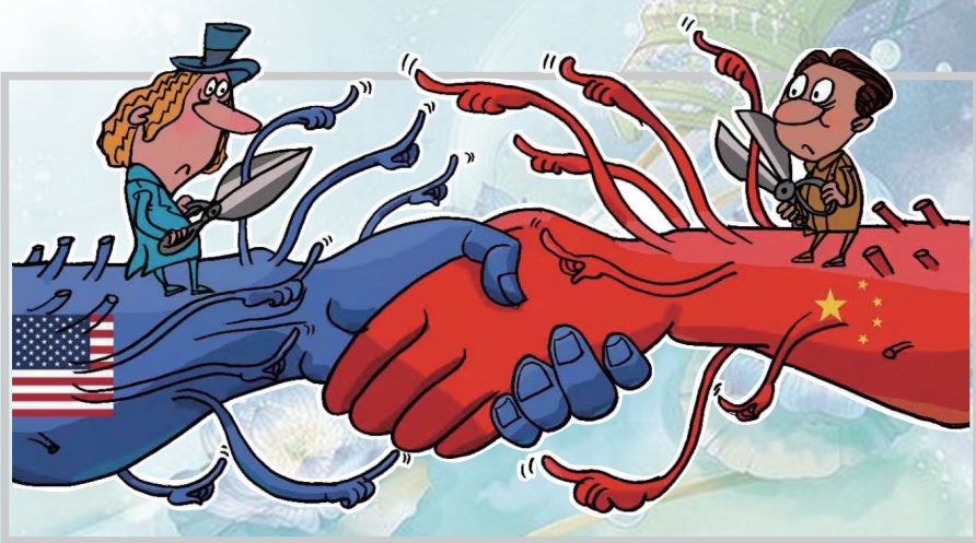
管控分歧 相向而行 方文林