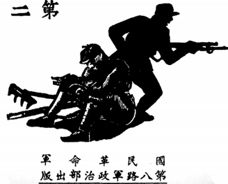
革命军 版出部治政军路八第