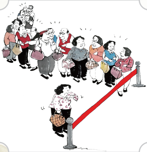
买啥？忘了！我们是来说说话的。