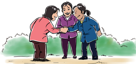
排忧解难的服务员