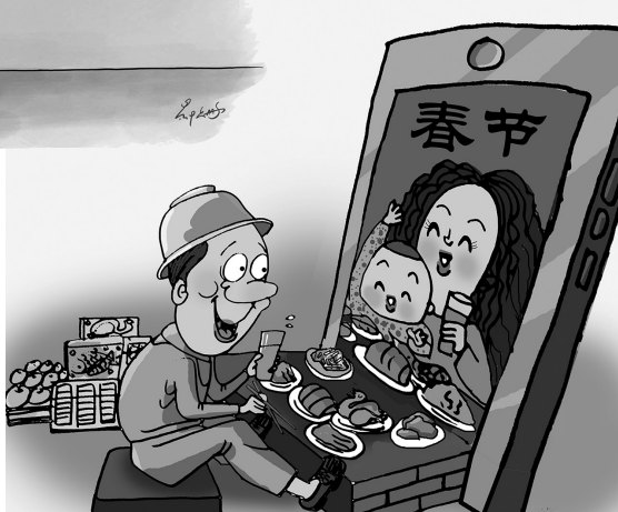
→ 不一样的团圆 方文林