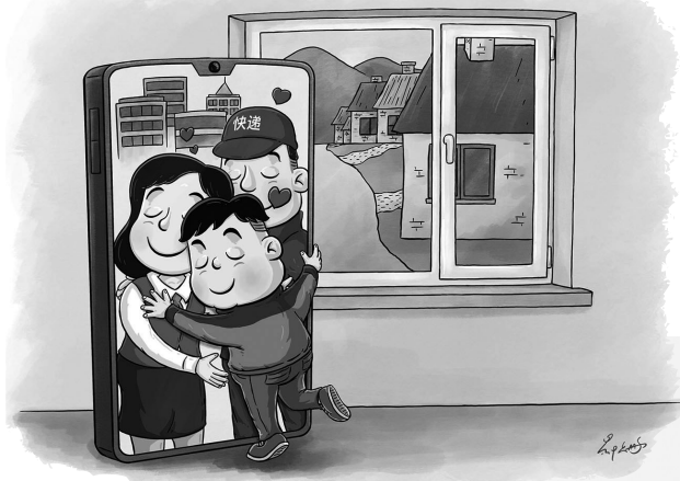
↑ 团聚 郝延鹏