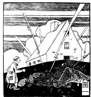
管闲事的使团说:『与我无关』

大革命失败的第三个原因是中国共产党尚处于幼年期,缺乏足够的理论准备和实践经验,未能保持在国民党中的独立性,不敢争取对国民党的领导权,在发展共产党的独立武装以及进行土地革命等重大问题上存在着保守退让的错误。除了以上原因,苏联和共产国际的错误指导对大革命失败也负有不可推卸的责任,经受了血与火考验的共产党人此后迈入了独立探索中国革命新道路的土地革命战争时期。(作者系中国政法大学教授)注:图一作者黄文农,选自《黄文农漫画选》第25页。图二为南昌市党部宣传部创作,选自《中国漫画史》第95页。