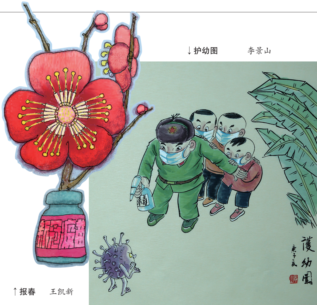
↓ 护幼图 李景山