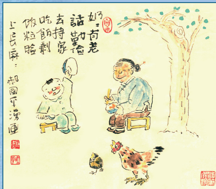
奶奶有老话,勤俭去持家。 吃饭剩饭粒,脸上长麻麻。