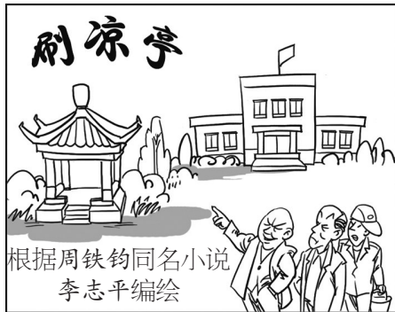
根据周铁钧同名小说 李志平编绘

局机关大院的绿地中间，新建一座钢筋水泥凉亭。办公室主任来请示分管的田副局长刷什么颜色，田副局长说刷绿色。