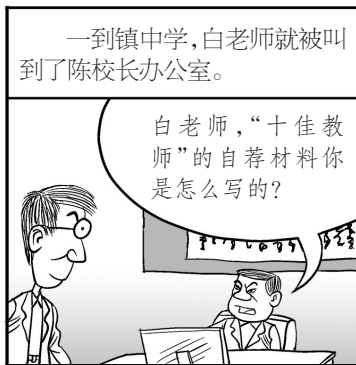
根据岳永杰同名小说 傅显渝编绘