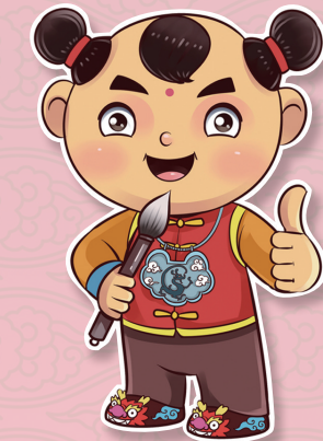
← 薪娃 与 火姐 →

中国美术家协会漫画艺委会名誉主任徐鹏飞希望《讽刺与幽默》报国学·经典专版在创新漫画传播方面,大胆地尝试创新性的发展途径。保护好优秀传统文化,通过漫画文创、漫画产业园、漫画主题活动场馆、主题漫画活动、漫画新媒体等,诠释好和传播好国学经典文化,使国学经典与当代社会相适应、与现代文明相协调、与世界文化发展趋势相符合、与全人类优秀文化相汇通。